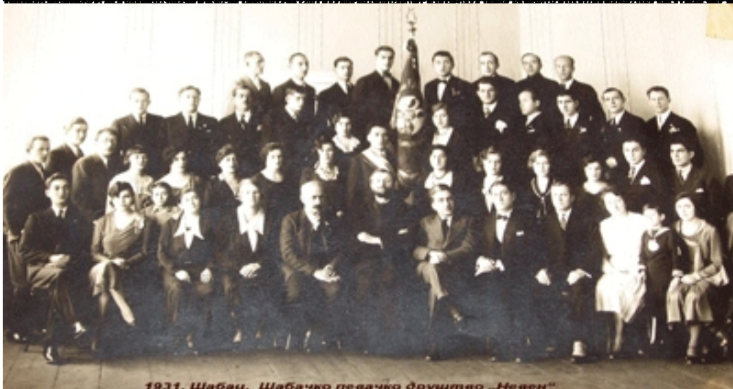
1931. Шабац, Шабачко певачко друштво „Невен“

Београдски Српски народни ансамбли у савременој музичкој средини Архив Српске народне музике 1979. и 1998. године,